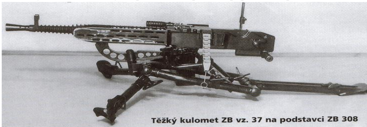
Těžký kulomet ZB vz. 37 na podstavci ZB 308

První ráno, kopřiváky páchnoucí naftalínem, běh na 1km tam, prostná, 1km zpět. Kopřiváky žerou a žerou. Bohudík jsme vyfasovali letňáky (letní plátěné stejnokroje), pak už to bylo nesitelné. Veškeré přesuny poklusem, poddůstojníci kromě jednoho dosluhujícího četaře řvou jako pomínutí! Poplach za poplachem, spíme v masce.